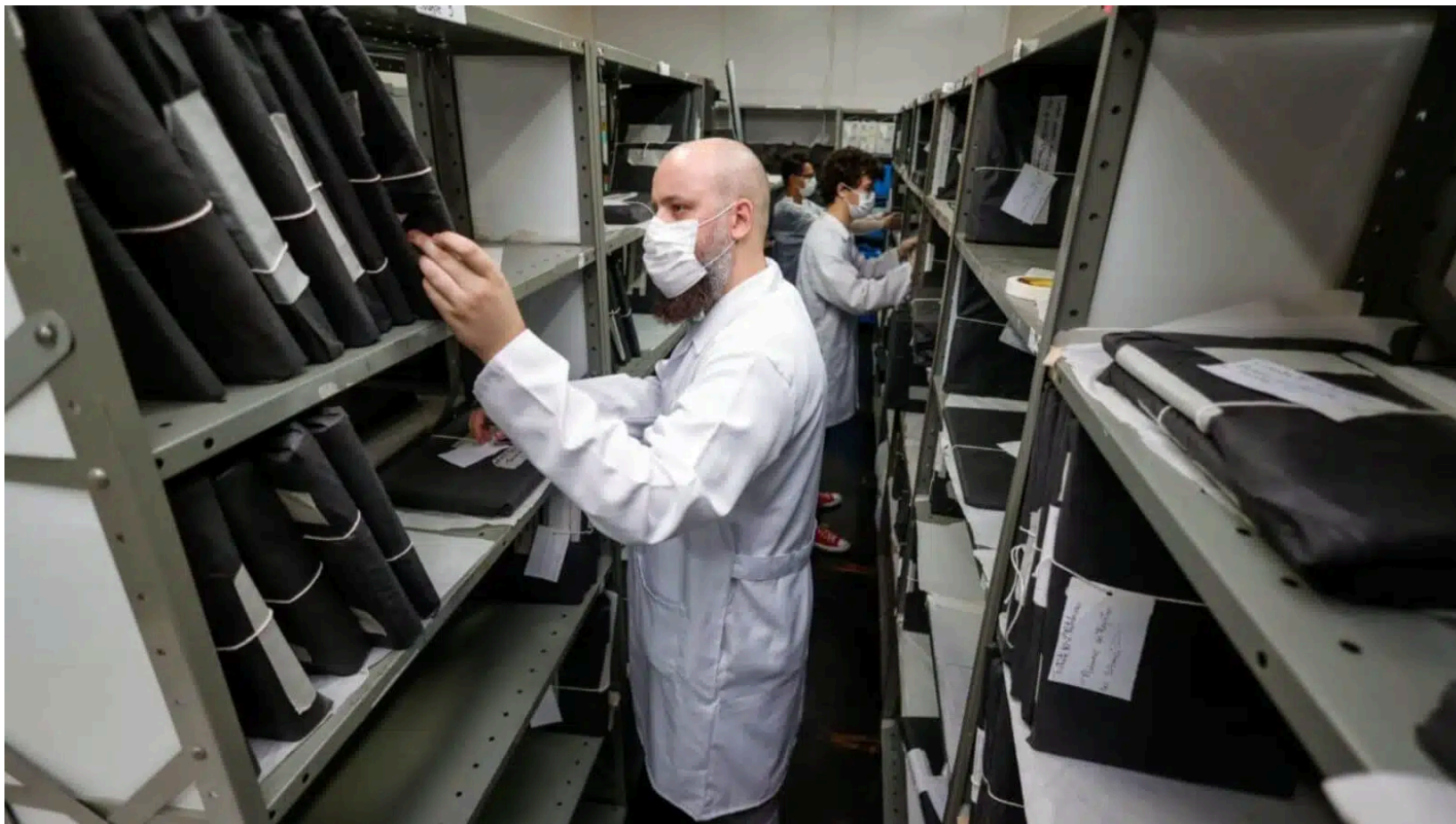
Com o parecer favorável e unânime, pedido de tombamento do acervo será analisado pelo Conselho

A gestão municipal dá um passo crucial para a preservação da história da cidade com a aprovação do tombamento do acervo do Arquivo Histórico de Jundiaí pelo Conselho Municipal do Patrimônio Cultural ( Compac ). A decisão unânime dos 13 conselheiros presentes na sessão ordinária garante a proteção do patrimônio documental da cidade.