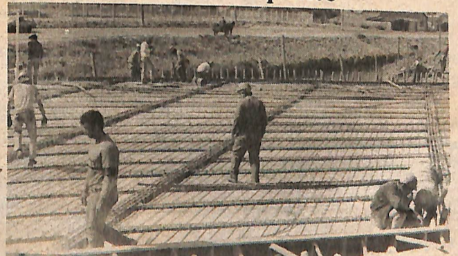
Chega de enchentes. É um pedido de muita gente.