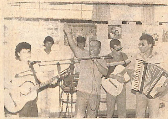
O Show de "Aventureiro e Conquistador", no mês passado.