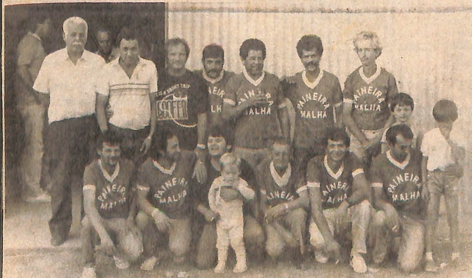
Na malha o Paineira é campeão Esporte na página 8

ponto de vista de cada um" — comenta. Esse é o papel do artista: ver as coisas de modo diferente, provocando o pensar. Outros talentos estão presentes no bairro, como mostramos na página 7.