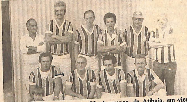
O time do São Lourenço, de Atibaia, em vice.