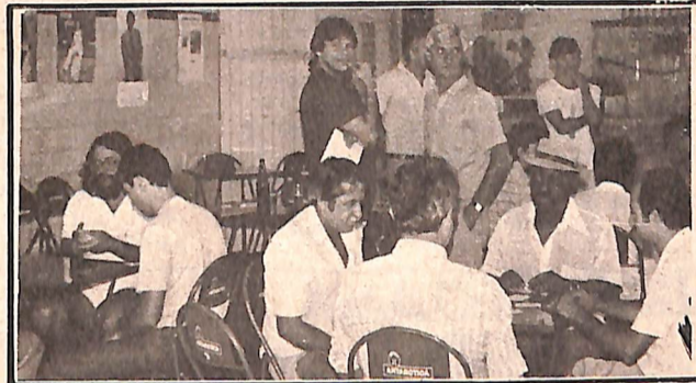
Boa movimentação na Lanchonete da Neuza, toda a manhã.