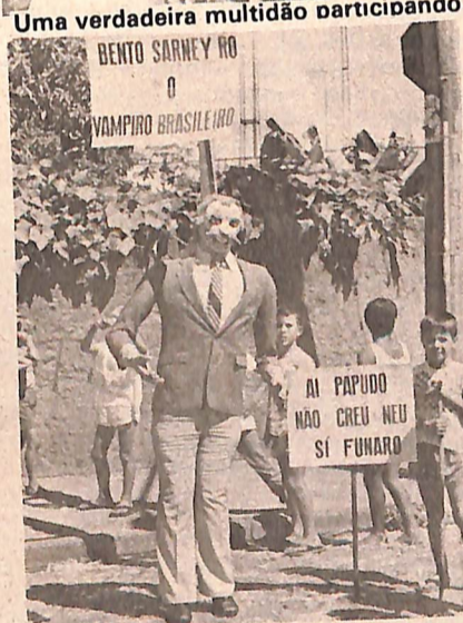
O boneco, antes do meio-dia. local onde foi instalada a força do presidente. Mem-

bro do bloco Unidos do Jardim Rio Branco ajudaram a elevar o clima de festa, fazendo um batuque exclusivo, que não será mais visto nem mesmo no