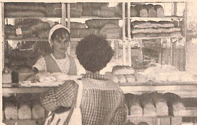
Uma variedade de produtos à sua disposição

A variedade muda aquele antigo hábito das pessoas, comprando automaticamente os seus pães diários. Agora