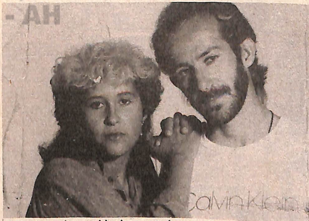
A dupla mais querida da garotada