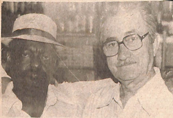
Os mais de cem anos de "manha" garantiram um novo título à dupla. Página 8