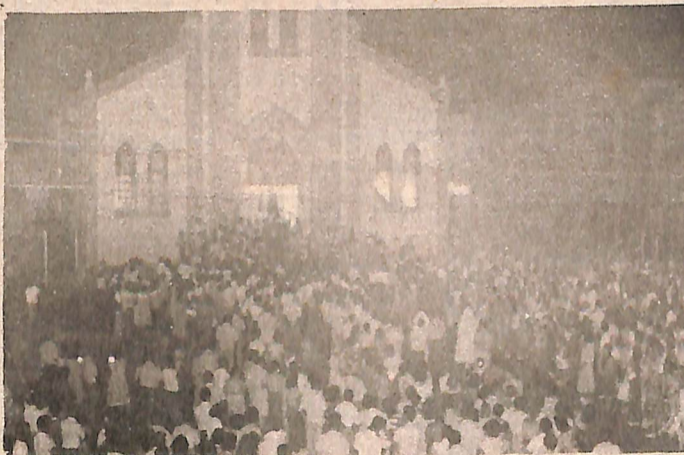
Na sexta-feira Santa, a prova de fé de nossa população. Uma incrível demonstração de fé foi dada por milhares de fiéis que tomaram nossas ruas. Página 3