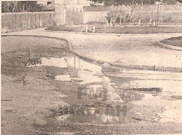
Buracos, uma rotina nas ruas do bairro.